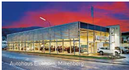
Autohaus Eichhorn, Miltenberg

Entdecken Sie attraktive Aktionsmodelle und viele weitere Top-Angebote auf unserer Homepage: www.auto-eichhorn.de